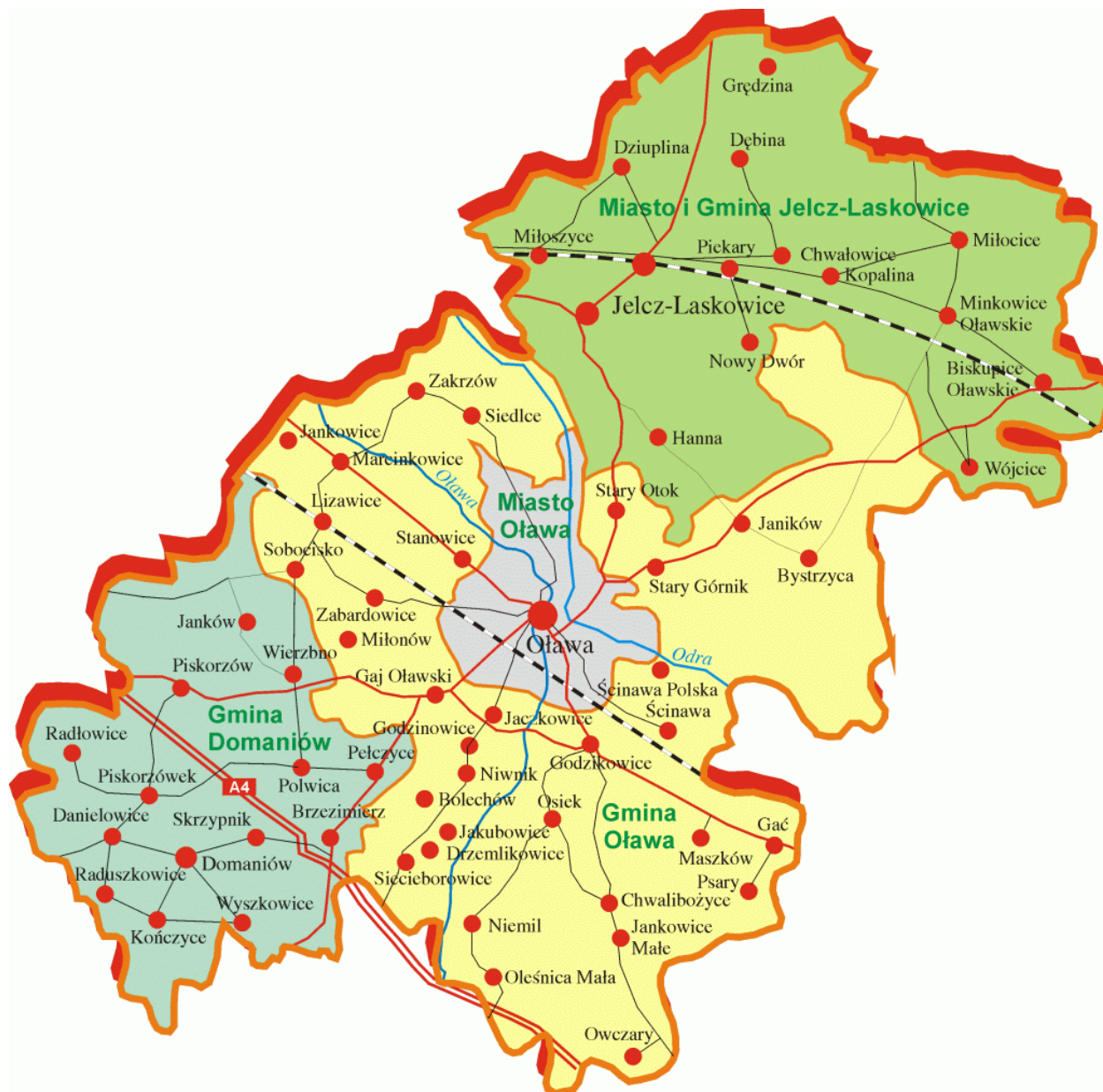
Tabela nr 1 c